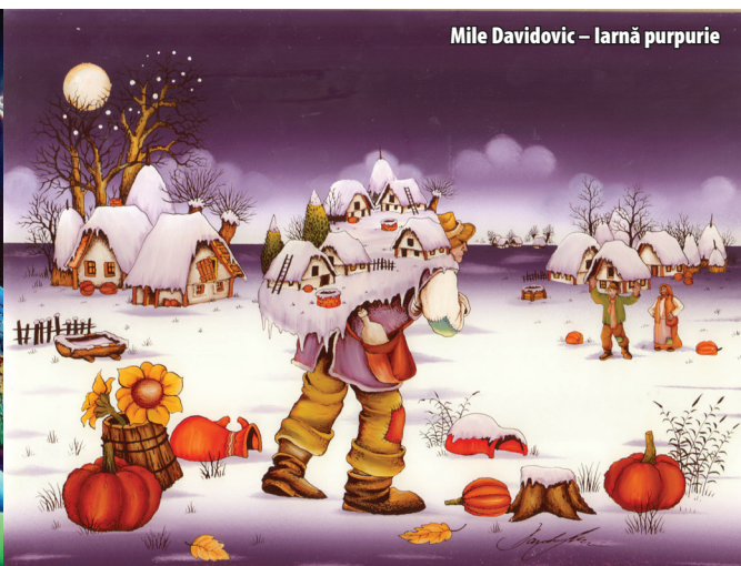
Mile Davidovic – Iarnă purpurie