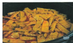
Fasole grasă prajită