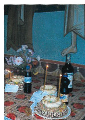
Pomenirea morților în Postul Paștelui