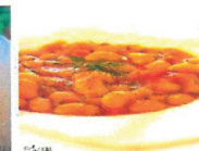
Iahnie de fasole