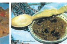
Pilaf cu prune uscate