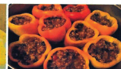
Ardei umpluți cu orez