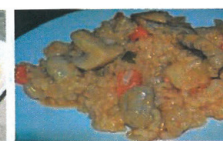
Pilaf de hribi