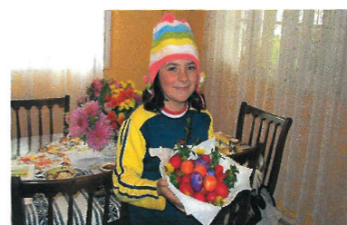
Ovă roșii la Paște