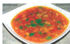
Supă de fasole boabe