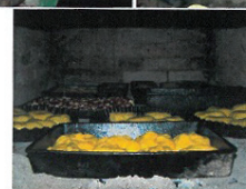
Sat Cucuieți, Comuna Solonț – Preparare plăcinte