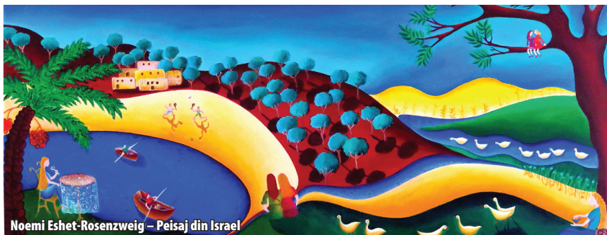
Noemi Eshet-Rosenzweig – Peisaj din Israel