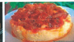
Fasole boabe făcăluită